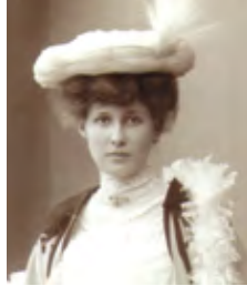
Dr. med. Ita Wegman (1876–1943)