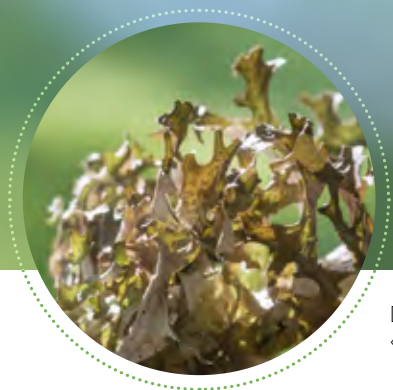
Die Flechte «Isländisches Moos»

dass es 12 bis 15 Jahre dauert, bis aus den Kernen erntefähige Mistelbüsche werden?