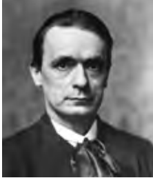
Dr. phil. Rudolf Steiner (1861–1925)

«ISCADOR, das sind doch die von der Weleda?» Nein, diese Zeiten sind vorbei. Aber wir erzählen Ihnen, wie es dazu kam.