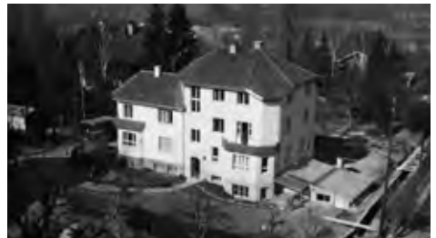
Institut Hiscia im Jahre 1952