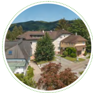
2015 Iscador AG

Er gliederte die Iscador AG als neue Organisation aus, die sich seit 2015 um sämtliche operativen Tätigkeiten sowie die Vermarktung und den weltweiten Vertrieb der Arzneimittel kümmert. Die Mitarbeitenden und Räumlichkeiten für die Herstellung wurden in die Iscador AG integriert. Auch die im Institut Hiscia jahrzehntelang gewachsene Herstellungs- und Forschungskultur findet sich in der Iscador AG wieder. Tag für Tag arbeiten alle unsere Mitarbeitenden mit viel Erfahrung, Herzblut und Motivation daran, Krebspatientinnen und -patienten mehr Lebensqualität zu schenken. Auf unseren Betriebsführungen gewähren wir Ihnen gerne einen Einblick und lassen Sie daran teilhaben.