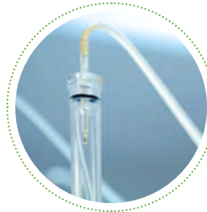
1972 Maschine 6